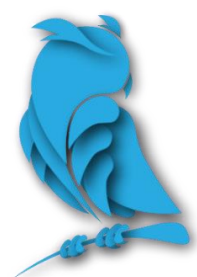
Рисунок 1 - Оформление рисунков и иллюстраций Рисунки только в формате .jpg